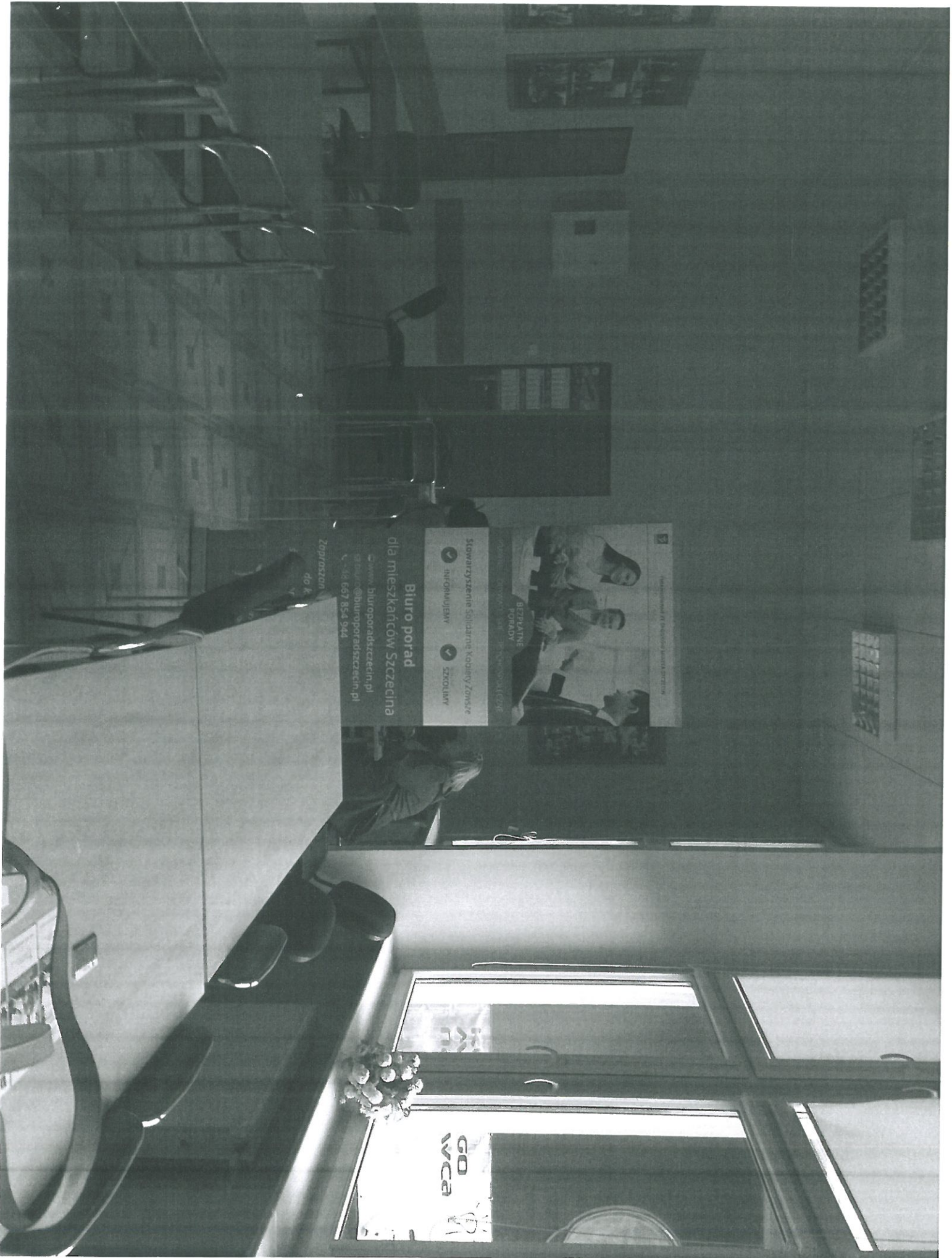
sale w której udzielane są porady